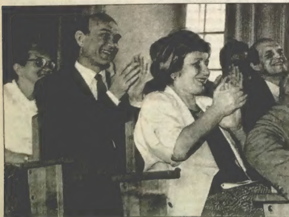
Падчас працы зьезду.

Не забывайцеся на тое, што вашаўя ўспаміны, якія часам з розных меркаваньняў недаацэньваюцца вамі, — каштоўнасьць, якая не павінна сыйсьці ў нябыт.